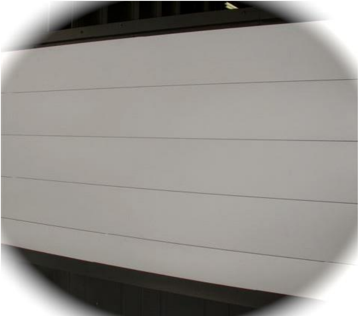
photo : profilé mural MS-9 , couleur GRIS MÉTALLIQUE TITAN MHQC-1900

FICHE TECHNIQUE MS- 9 PROFILÉ MURAL SANS VIS APPARENTES